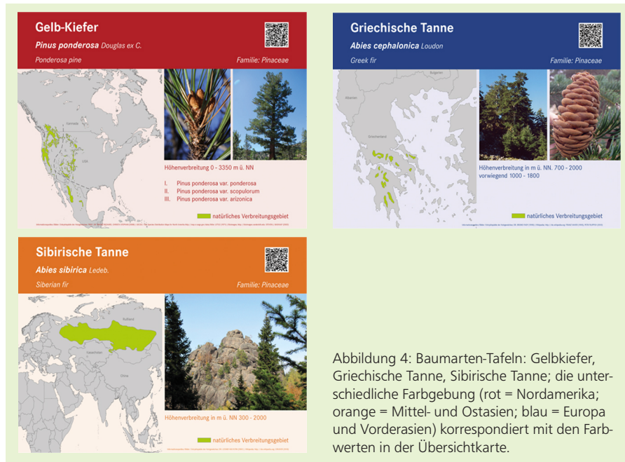
Abbildung 4: Baumarten-Tafeln: Gelbkiefer, Griechische Tanne, Sibirische Tanne; die unterschiedliche Farbgebung (rot = Nordamerika; orange = Mittel- und Ostasien; blau = Europa und Vorderasien) korrespondiert mit den Farbwerten in der Übersichtskarte.

In der Mitte des Weltwaldes befindet sich ein größerer Pavillon. Er bietet Raum für wechselnde Ausstellungen rund um die Themen Wald, Ökologie und internationale Forstwirtschaft (Abbildung 4). Mehrere Künstlersymposien haben in den vergangenen Jahren Skulpturen aus Holz hinterlassen. Sie machen den Weltwald als Ausflugsort attraktiv, auch für Besucher, die sich zunächst weniger für die Bäume interessieren.