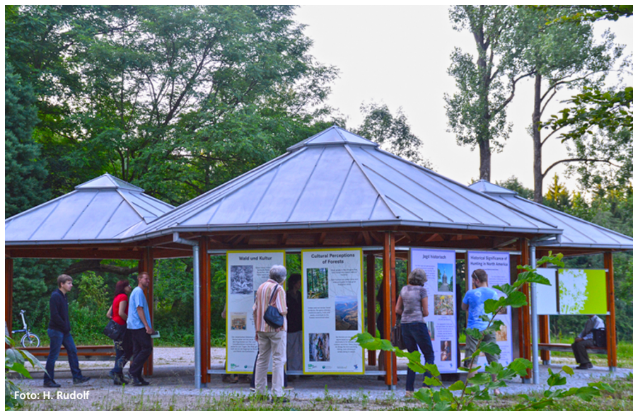
Abbildung 5: Zentralpavillon

In die gleiche Richtung zielt die noch in Planung befindliche Konzeption der Themengärten. An drei ausgewählten Plätzen – passend zur Gliederung nach Kontinenten – sollen erlebnisorientierte Angebote entstehen, die mit den kulturellen Aspekten der Baum-Heimatländer in Berührung bringen. Im Fokus stehen dabei weniger wissenschaftliche Fragen als vielmehr die Ansprüche von Familien mit Kindern an ein spannendes Ausflugsziel.